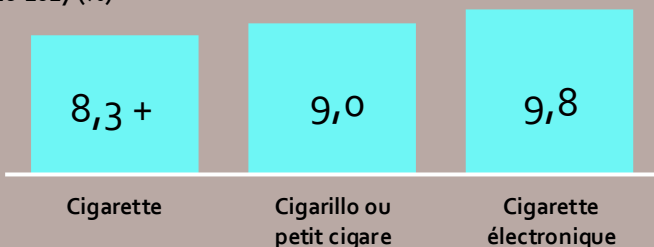
Élèves des écoles secondaires ayant utilisé des produits du tabac ou de vapotage au cours des 30 derniers jours selon le produit, Lanaudière, 2016-2017 (%)

(+) (-) Valeur significativement différente à celle du reste du Québec, au seuil de 5 %. Source : ISQ, Enquête québécoise sur la santé des jeunes du secondaire 2016-2017 . Rapport de l'Infocentre de santé publique du Québec. Mise à jour le 4 avril 2019.